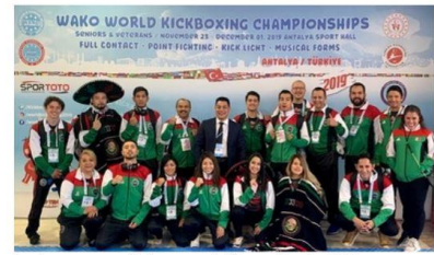
La justa mundialista recibió a más de 690 deportistas procedentes de 63 naciones.

La segunda etapa se llevó a cabo del 23 de noviembre al 1 de diciembre en Antalya, Turquía, donde participaron 17 atletas en las modalidades point fighting, kick light, formas musicales y full contact.